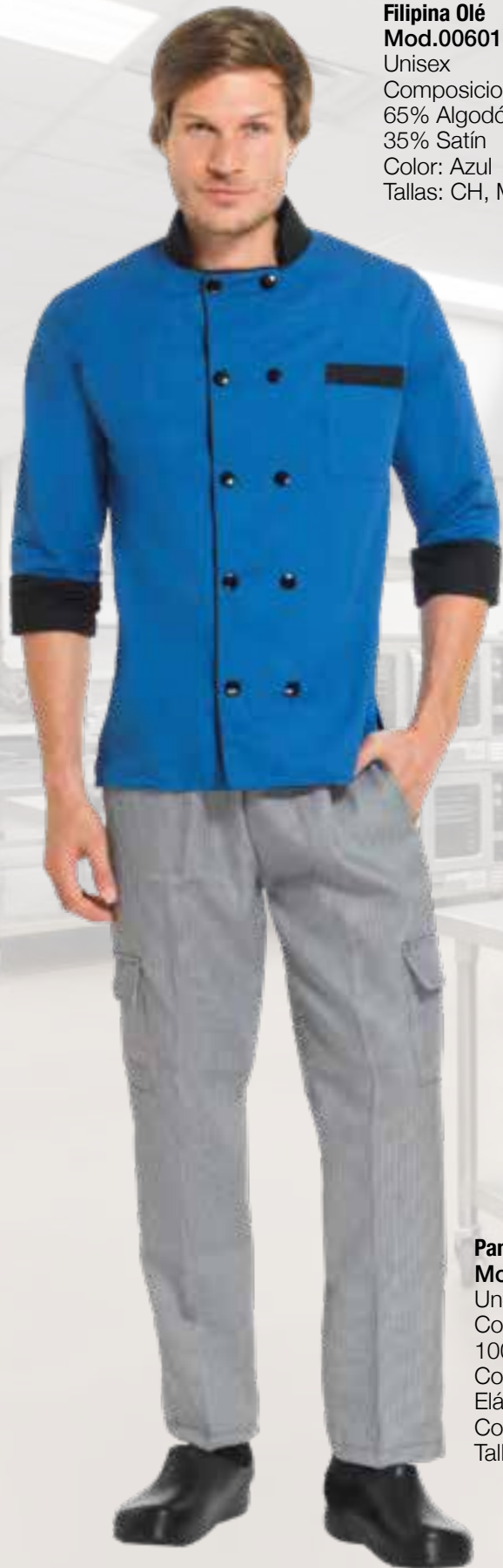
Filipina Olé Mod.006019 Unisex Composicion: 65% Algodón 35% Satín Color: Azul Tallas: CH, M, L, XL, XXL